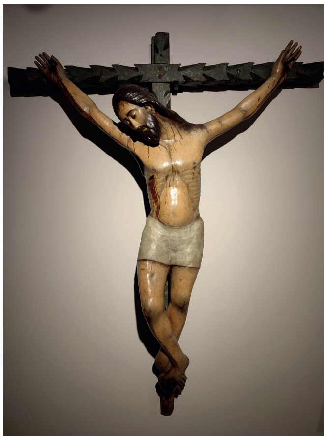
26 de noviembre | El Cristo de la Sangre en la exposición "Arte y Devoción en Andalucía" en la Fundación Cajasol