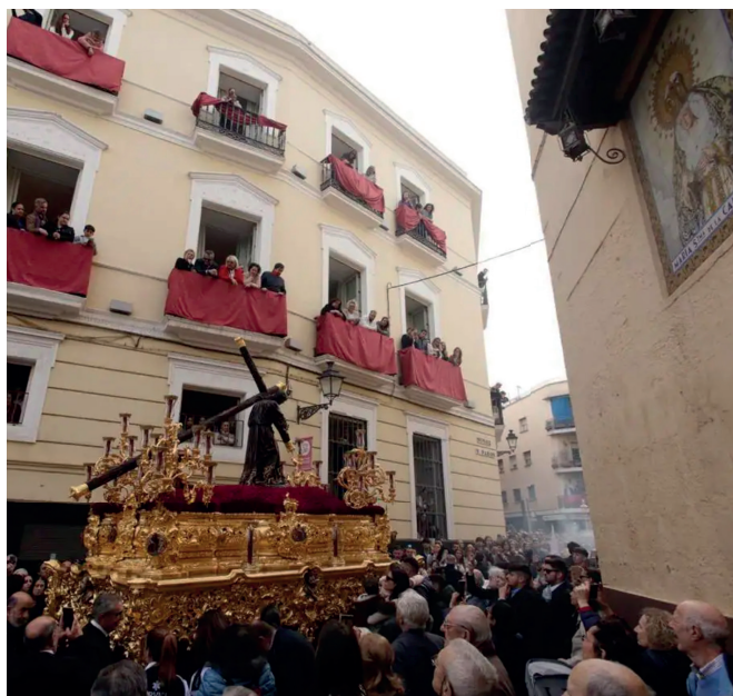
26 de marzo | Martes Santo.