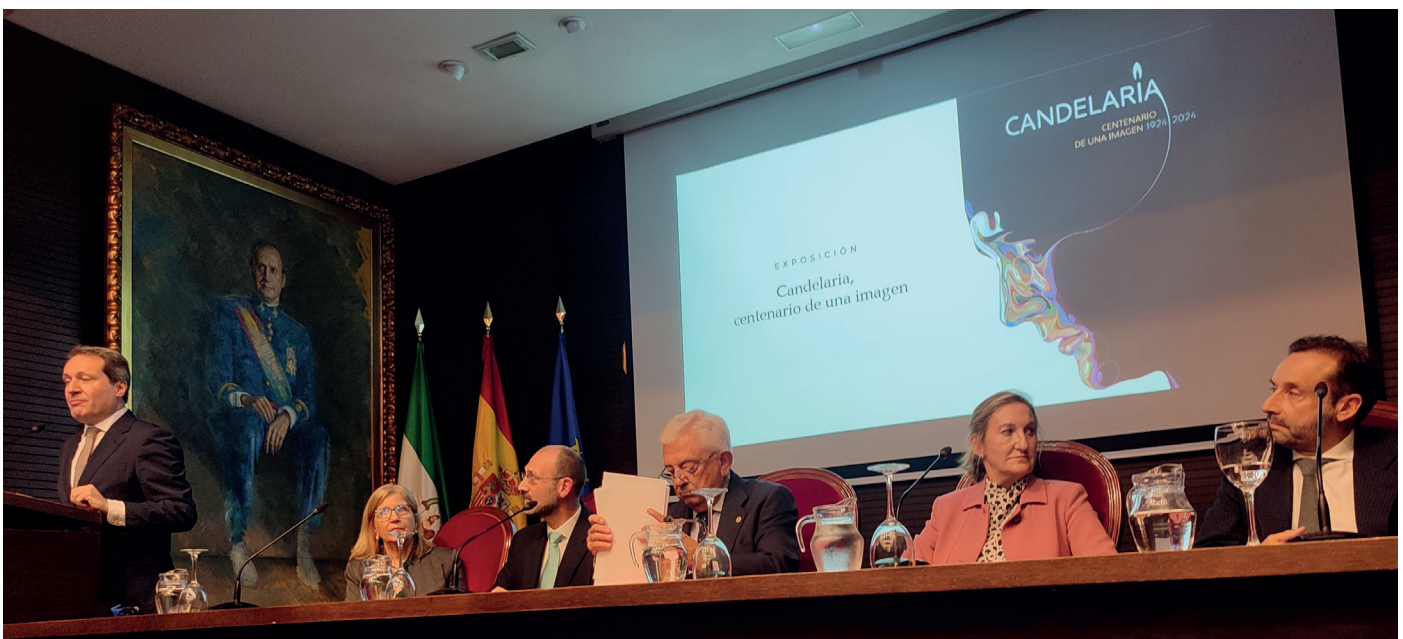
Acto de inauguración de la Exposición