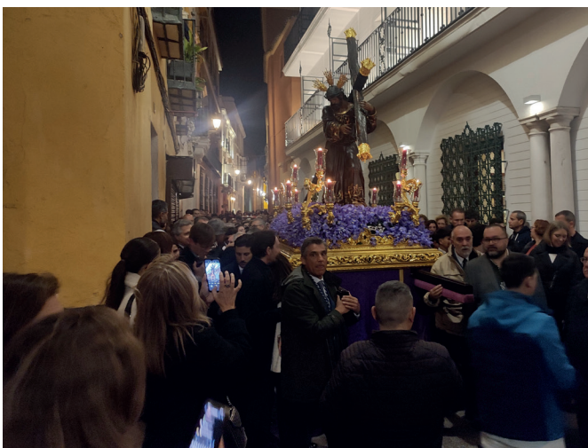
1 de marzo | Via Crucis con la imagen del Señor por las calles de la feligresía