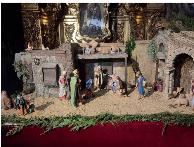
8 de diciembre | Belén instalado en la iglesia de San Nicolás