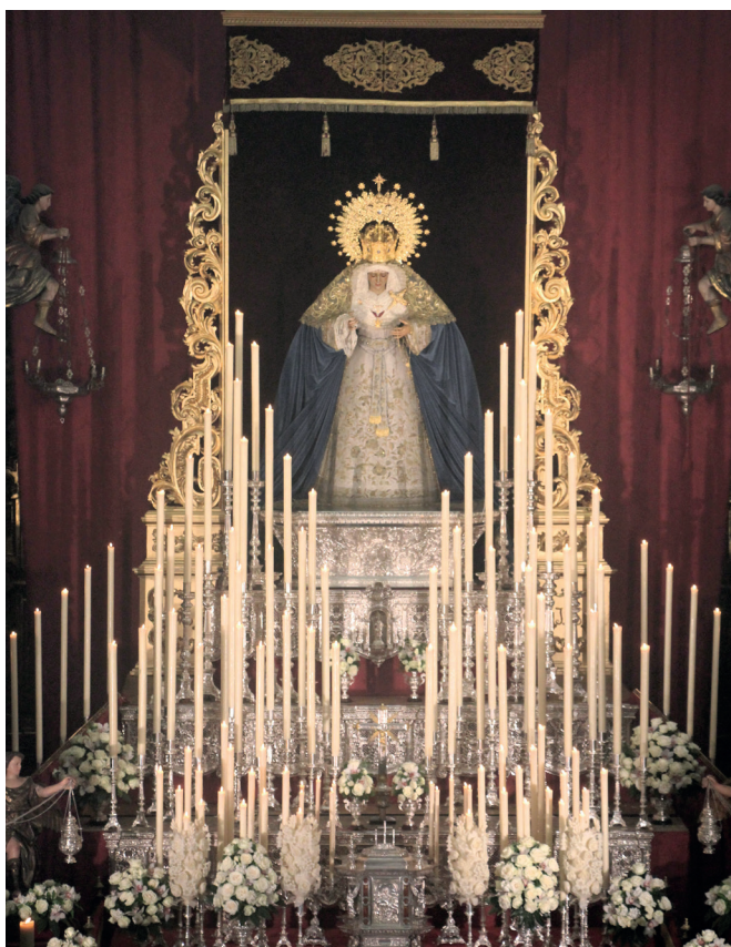
9 de febrero | Altar de Triduo y Función del Centenario de la imagen de la Virgen (1924-2024)