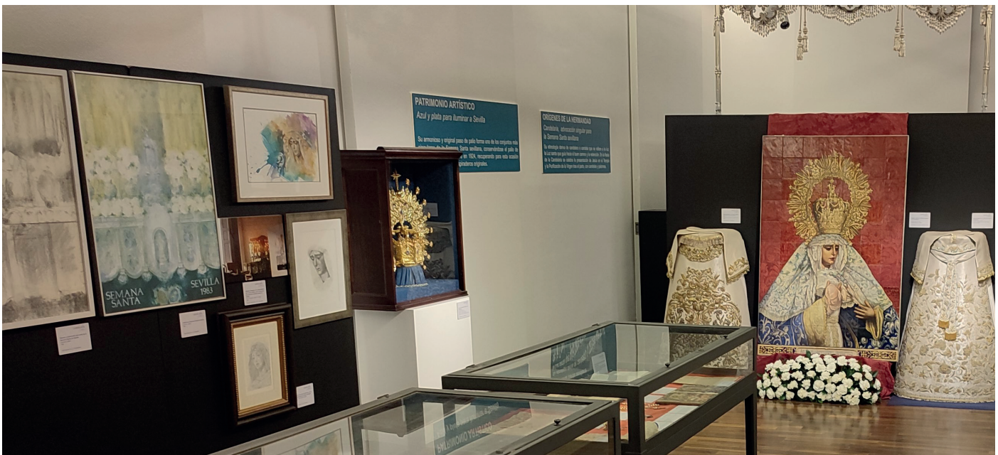
Vista general de una de las salas de la Exposición