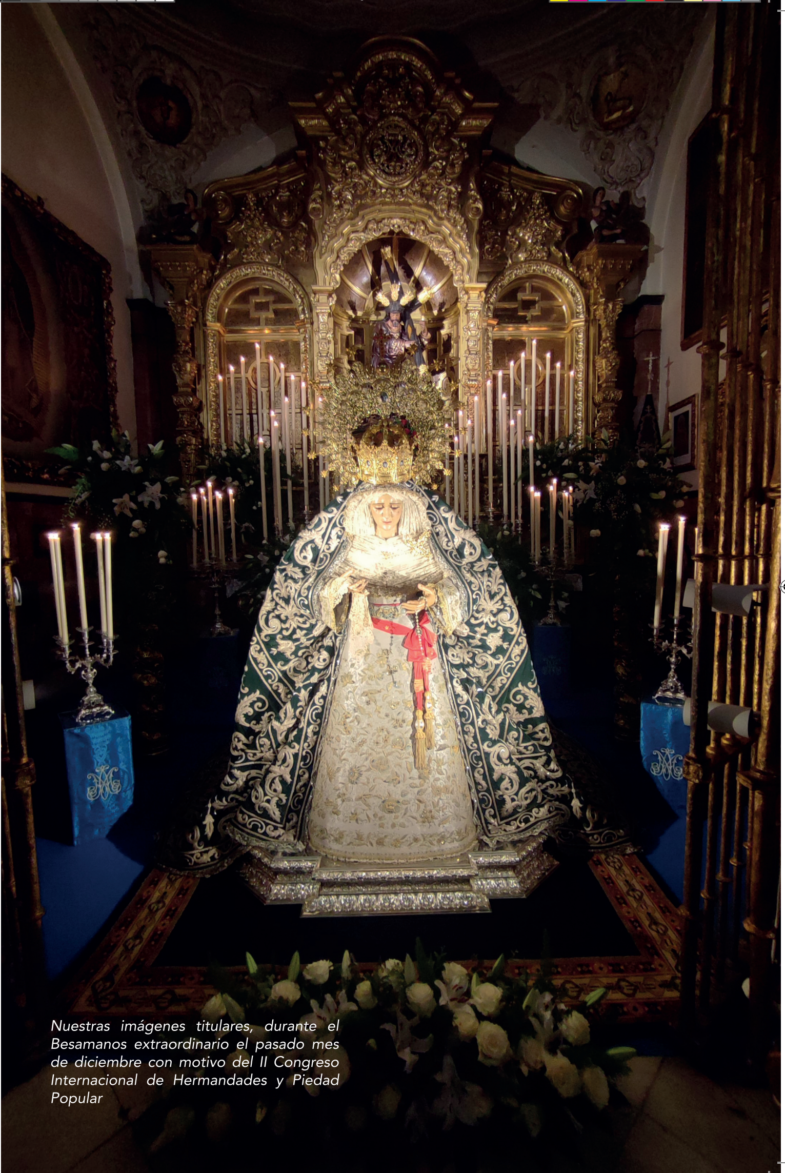
Nuestras imágenes titulares, durante el Besamanos extraordinario el pasado mes de diciembre con motivo del II Congreso Internacional de Hermandades y Piedad Popular