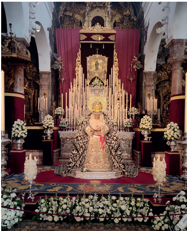
2 de febrero | Besamanos a María Stma. de la Candelaria