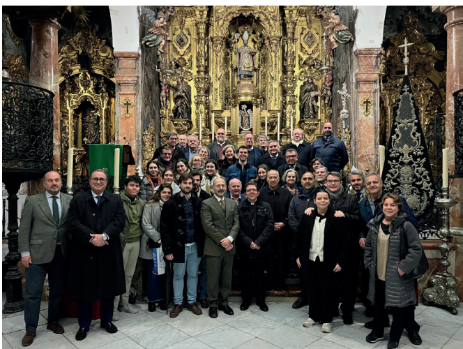
9 de enero | Conferencia y visita del Obispo Auxiliar Ramón Valdivia