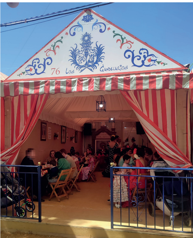
Feria de abril