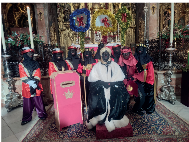
22 de diciembre | Visita del Cartero Real de SS. MM. los Reyes Magos