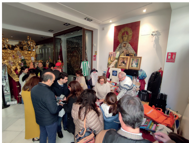
22 de diciembre | Tómbola Benéfica navideña