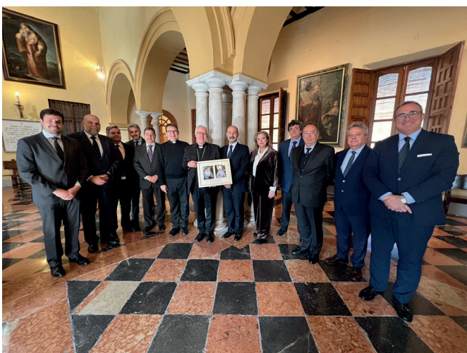
2 de febrero | Visita al Sr. Arzobispo de la junta de gobierno