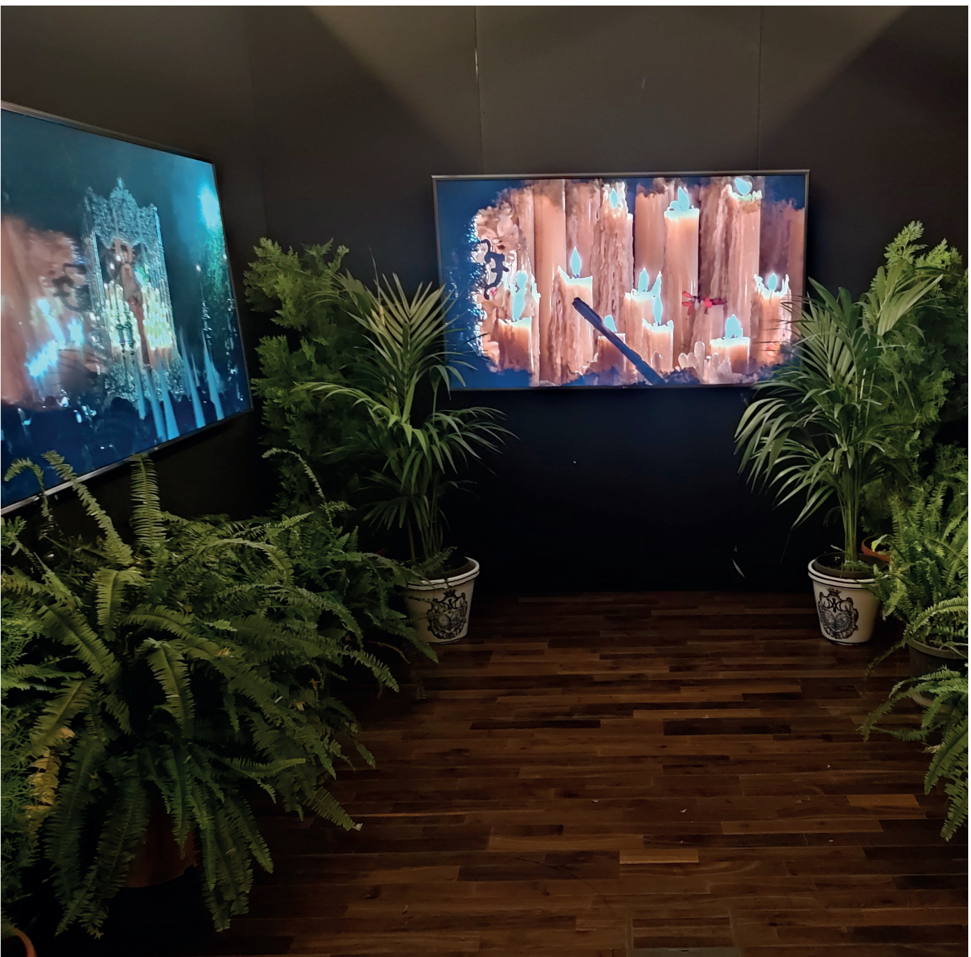
Audiovisual recreando los Jardines

Solo nos queda agradecer a cuantos profesionales han colaborado desinteresadamente al esplendor de ésta exposición, que ha recibido opiniones muy elogiosas de quienes la han visitado, al grupo de hermanos que se han entregado abnegadamente tanto en el montaje como en el desmontaje, así como al grupo de voluntarios que se han ido turnando durante todo el horario de apertura en las tres semanas que ha permanecido abierta para atender al público.