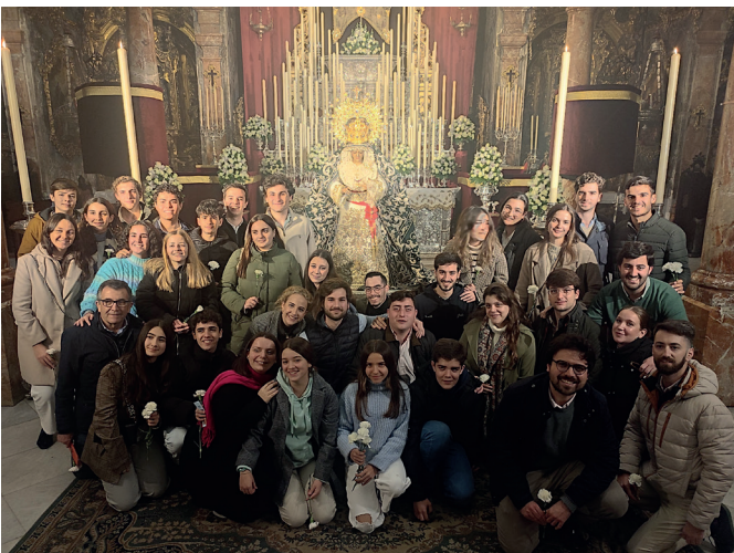
1 de febrero | Vigilia de la Juventud Candelaria a la Virgen