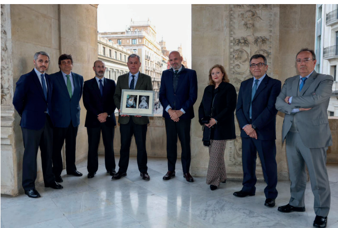
29 de enero | Visita de la junta de gobierno al alcalde de Sevilla, José Luis Sanz Ruiz