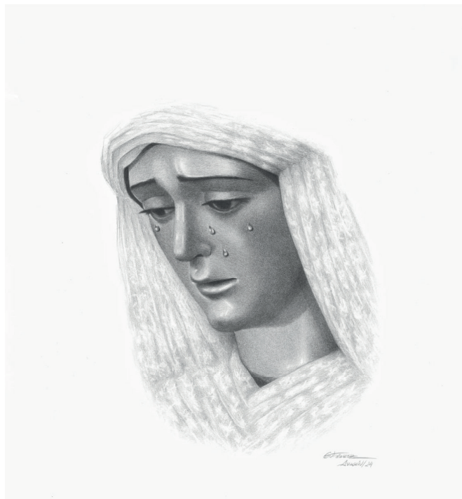
8 de febrero | Dibujo de la Virgen ejecutado por José Julián Gutiérrez Aragón