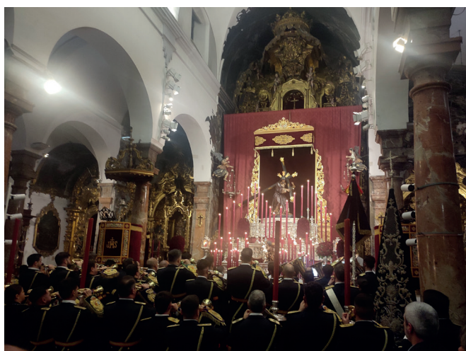
24 de febrero | Concierto de la Banda de las Tres Caídas