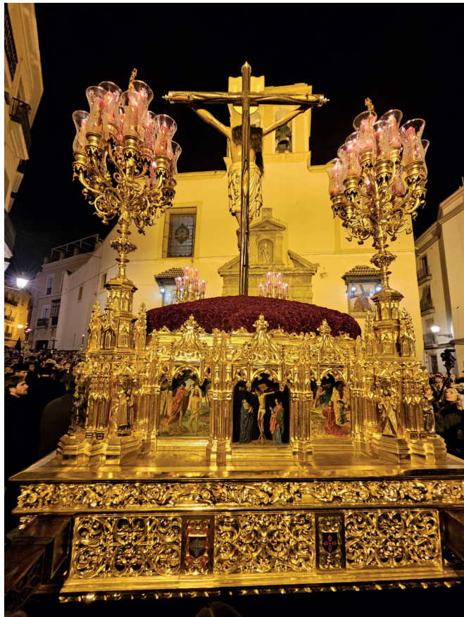
21 de diciembre | Recibimiento al Santo Crucifijo de San Agustín en su procesión extraordinaria