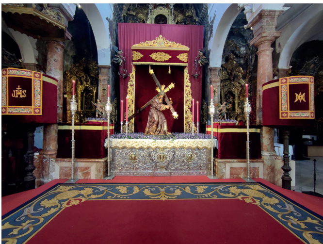
2 y 3 de marzo | Besapie a Nuestro Padre Jesús de la Salud