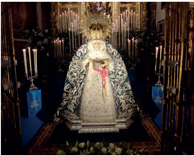
3 de diciembre | Veneración y Besamanos extraordinario por el II Congreso Internacional de Hermandades y Piedad Popular