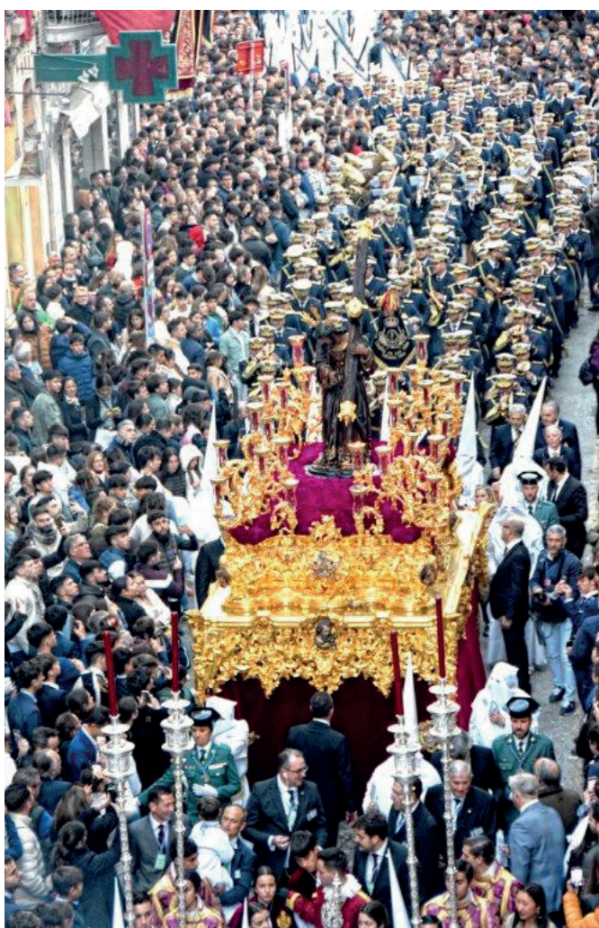
26 de marzo | Martes Santo. Ntro. P. Jesus de la Salud.