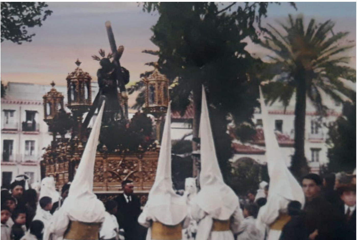
El Señor por los jardines en 1925 a color