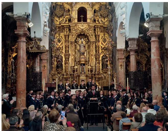
10 de marzo | Concierto de la Banda de la Cruz Roja