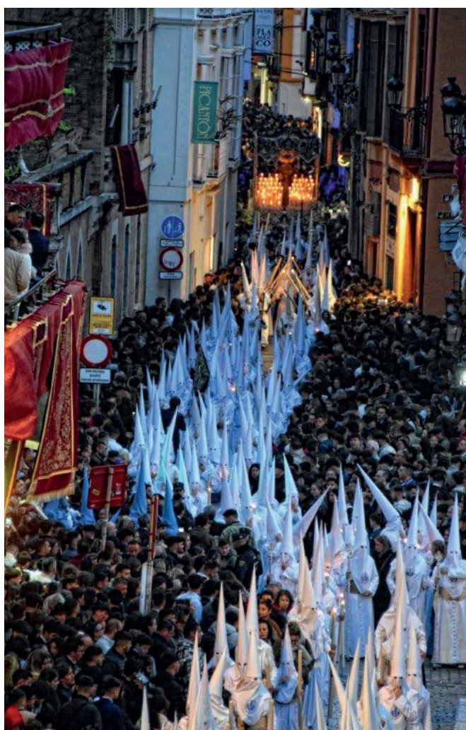
26 de marzo | Martes Santo.