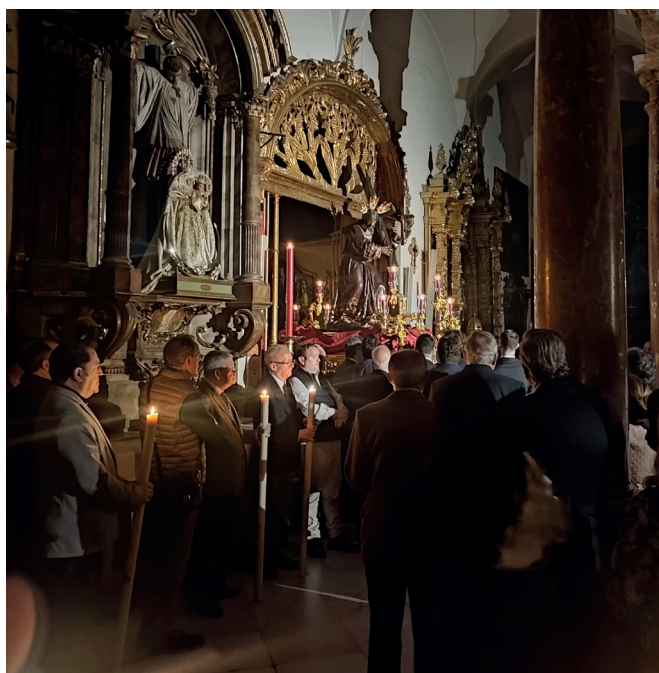
19 de marzo | Traslado de Ntro. P. Jesús de la Salud a su paso