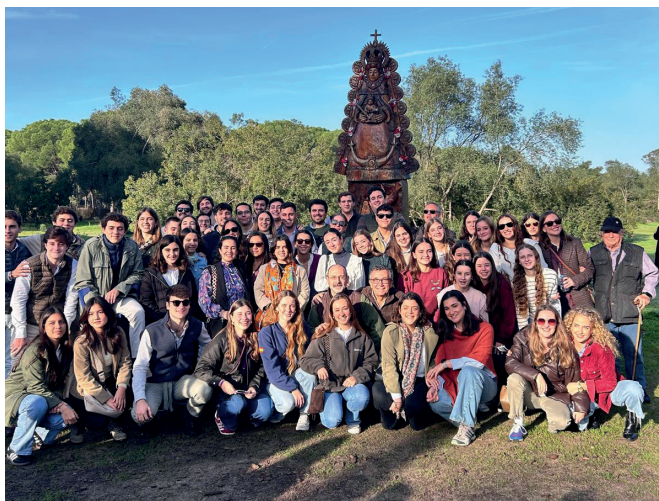
23 de noviembre | Convivencia en el Rocío