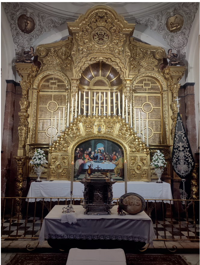
28 de marzo | Monumento del Jueves Santo