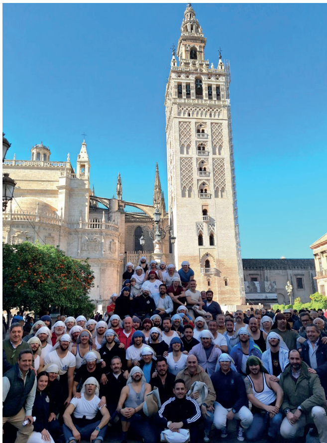
21 de enero | Ensayo de costaleros